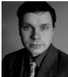
Kl. Gediminas G., I k.

Jėzus ėjo mokydamas per miestelius ir kaimus ir keliauvo į Jeruzalę (Lk 13, 22). Be praeities nėra dabarties, be dabarties nebus ateities. Dievas veikia istorijoje. Jis buvo, yra ir bus. Kiekviena parapija, miestelis ir žmogus turi savo unikalią istoriją. Vieniems ji artimesnė, kitiems – tolimesnė. Mano istorija susijusi su Salaku – miestelį kuriame gimiau, augau ir brendau. Čia mano proproproseneliai ir proseneliai gyveno, čia gyvena seneliai. Džiaugiuosi šiuo nenutrūkstamu kartų, tikėjimo, tradicijų, kultūros ryšiu.